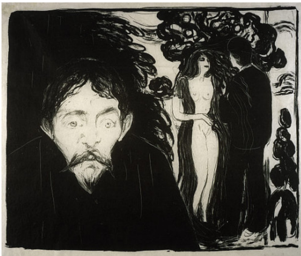
Document 1 : Jalousie II , 1896 Lithographie sur papier, 46,5 x 57 cm, Collection particulière.