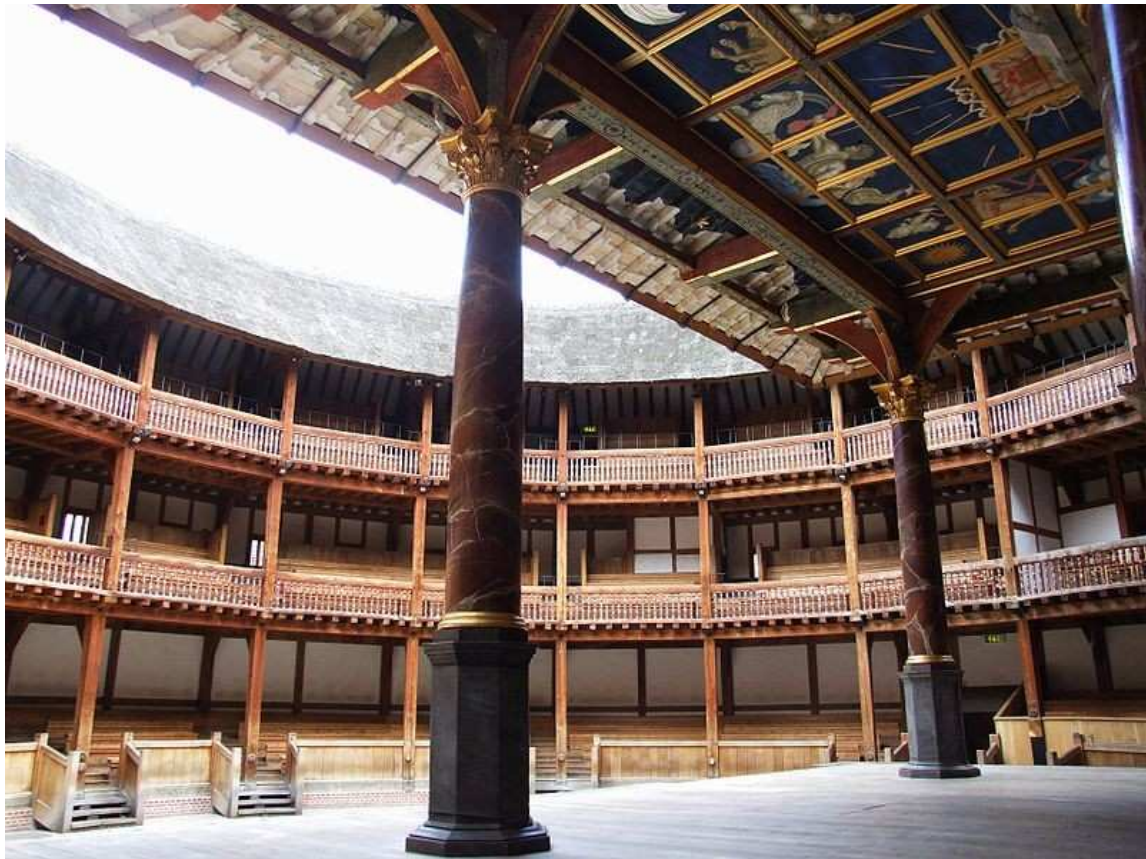
La scène et les galeries