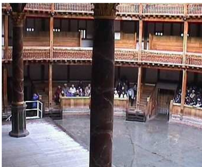
Vue de la scène