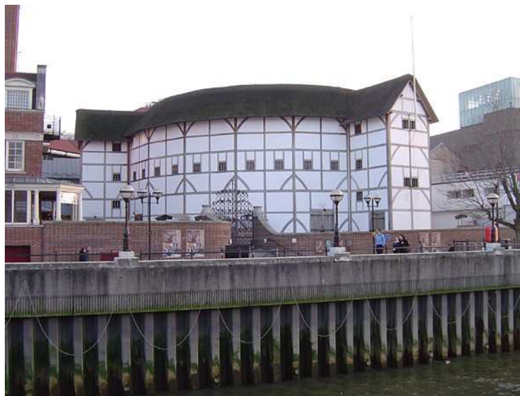
Vue extérieure du théâtre du Globe

L'actuel Shakespeare's Globe Theatre (théâtre du Globe de Shakespeare) a été reconstruit en 1996 et a ouvert ses portes en 1997. Il a été bâti à l'identique, d'après des plans élisabéthains de l'original et en utilisant les techniques de construction de l'époque. C'est l'acteur américain Sam Wanamaker qui fut l'instigateur de cette reconstruction. Le nouveau théâtre est situé à environ 230 mètres de l'emplacement historique. L'architecture d'origine a simplement été modifiée par l'ajout de gicleurs d'incendie sur le toit, pour protéger le bâtiment du feu. Comme à l'époque, seul le parterre est à ciel ouvert ; les galeries accueillant également le public et la scène sont couvertes. Les spectacles ont lieu pendant l'été. Les places les moins chères sont debout, au parterre, devant la scène.